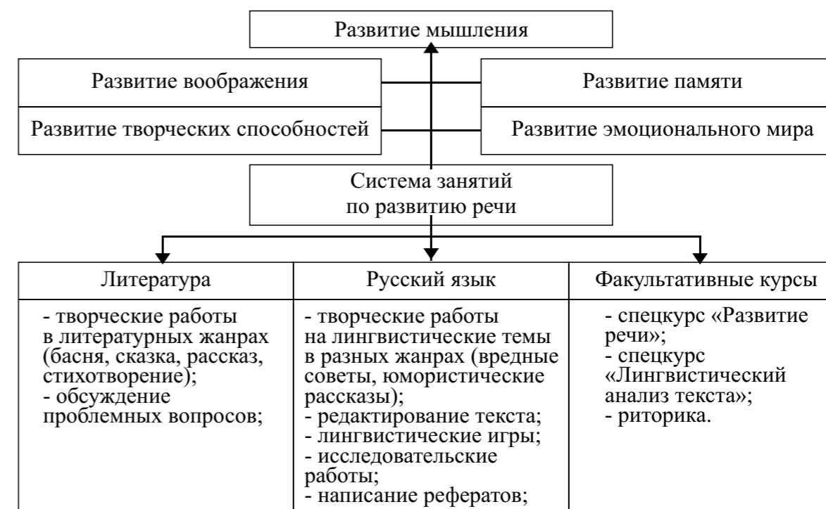
Рис. 1 Система по развитию речи на уроках русского языка и литературы.

Позднее была создана система формирования коммуникативной компетенции средствами современных образовательных технологий: технологии РО, риторизации преподавания русского языка и литературы, информационно-коммуникативных технологий, модель которой представлена на рис. 2