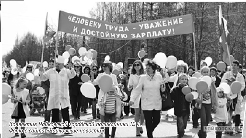
Коллектив Чайковской городской поликлиники № 1.