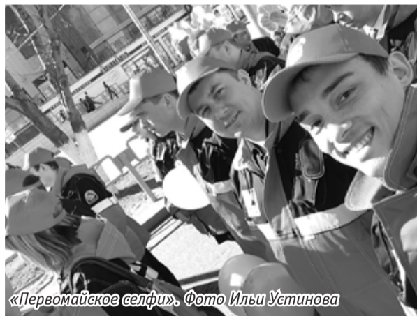
«Первомайское селфи».