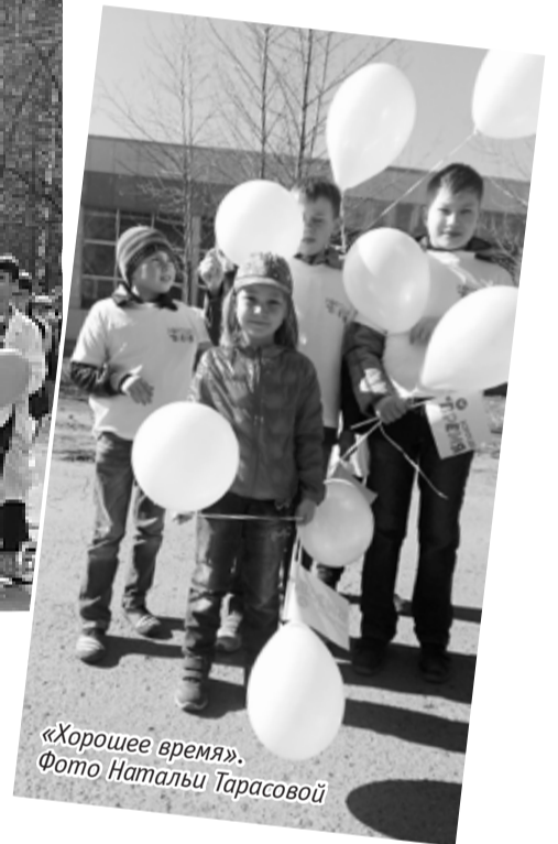
«Хорошее время».