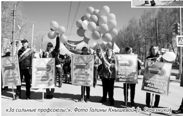
«За сильные профсоюзы!».