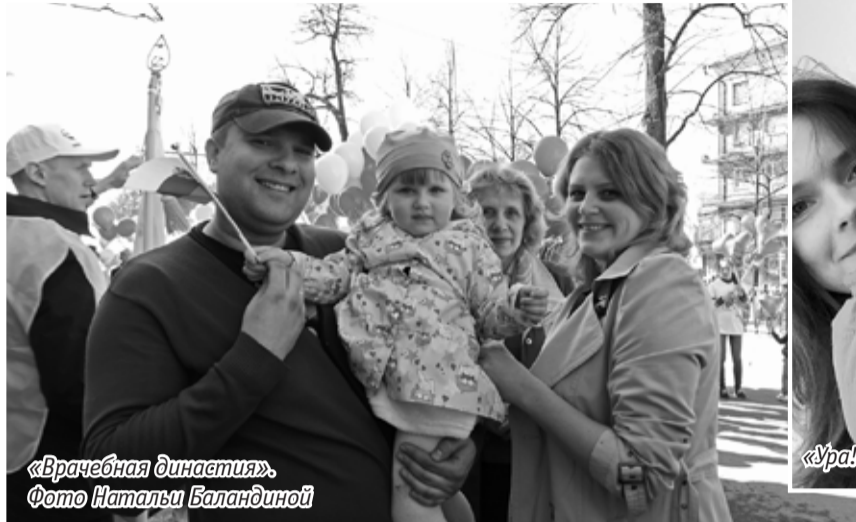
«Врачебная династия».