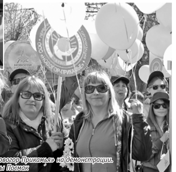
Коллектив «Новогор-Прикамья» на демонстрации.