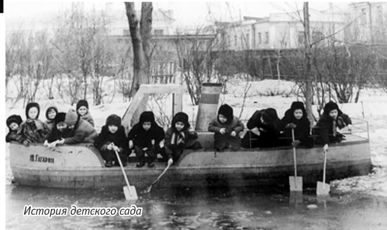
История детского сада

То, что педагогический коллектив такой дружный, очень важно и для детей. Здесь, как в любом современ-