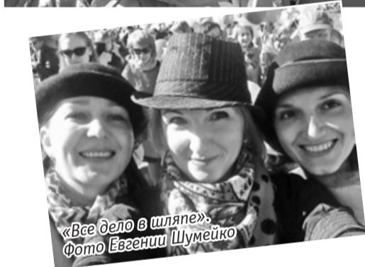
«Все дело в шляпе».