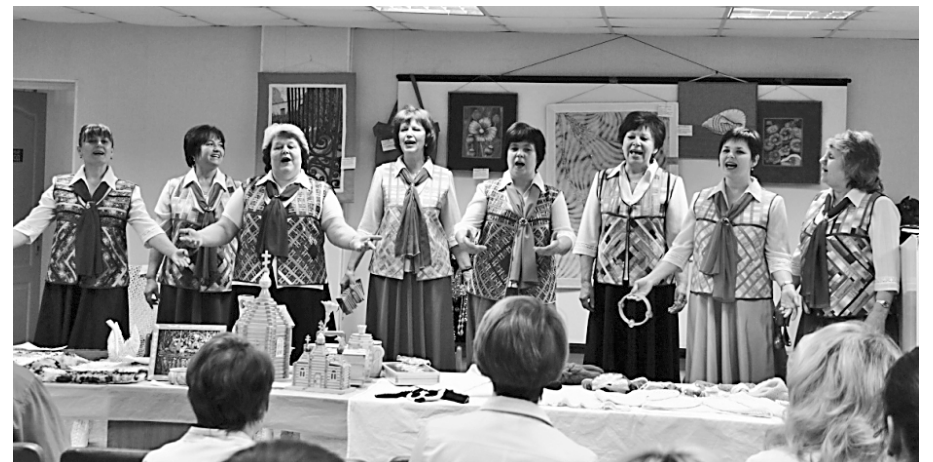
Богат талантами коллектив детской больницы № 13 (г. Пермь)