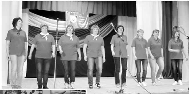
На сцене лидеры – команда Большесосновской средней школы