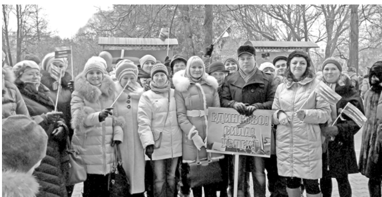
На митинге – коллектив детской поликлиники № 1 (г. Пермь)

По решению профсоюзных комитетов членам профсоюза оказывается материальная помощь в случае рождения ребенка, первого бракосочетания, к юбилейным датам