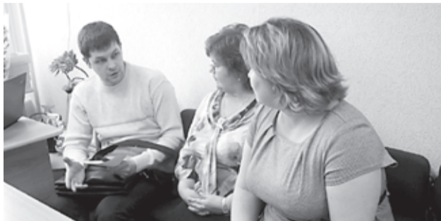
Юриста крайсовпрофа ждали